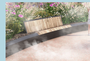
De nombreuses assises