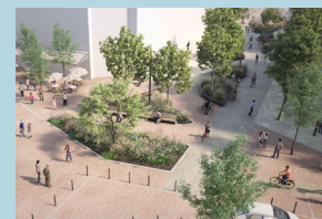
Une forte végétalisation