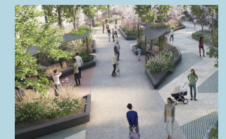
Un espace réservé à la piétonnisation